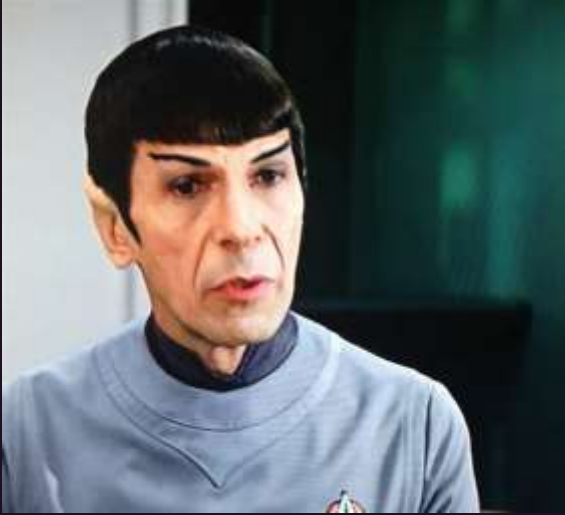
Vulkanier in Kontrolle